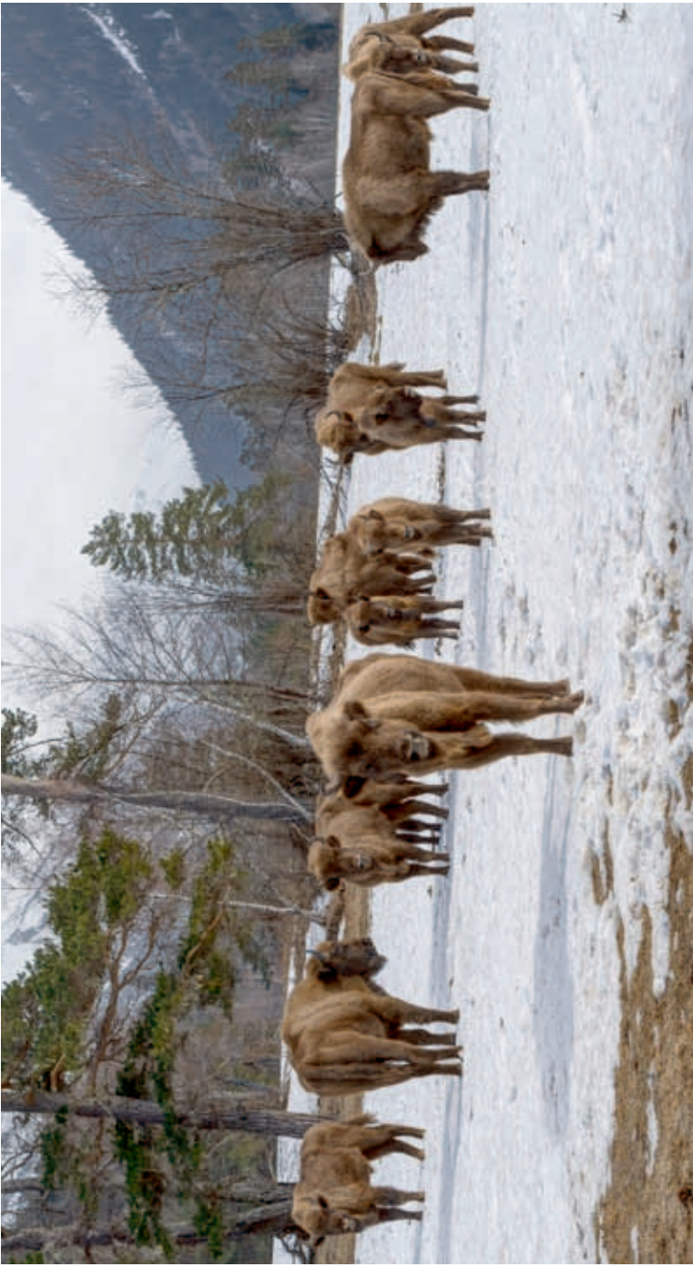
Free-living herd of the European bison

ARKHYZSKIJ UCHASTOK TEBERDINSKOGO ZAPOVEDNIKA, 07.04.2021