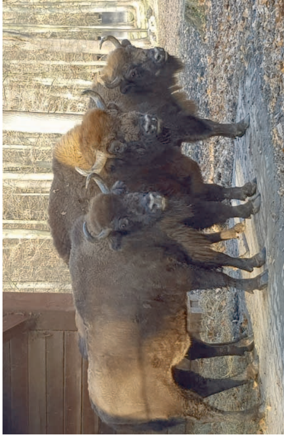
F 9365 PORCJA II, M 12292 PLISAR, F 12204 PLATANKA II