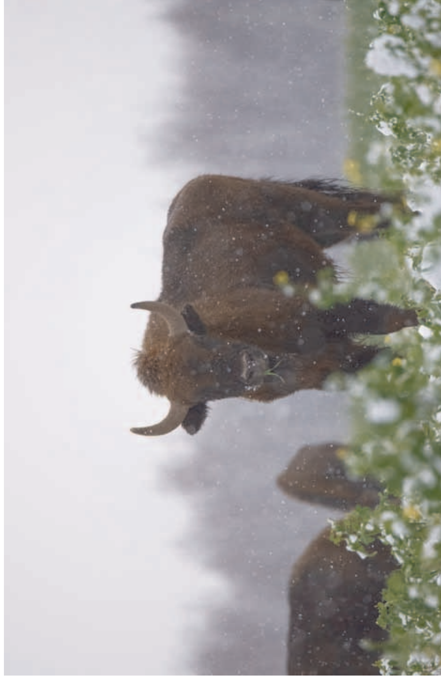
Free-living herd of the European bison on a rape field