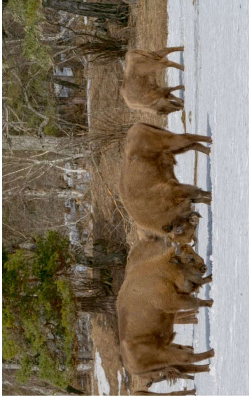
Free-living herd of the European bison

АРХЫЗСКІЙ УЧАСТОК ТЕБЕРДІНСКОГО ЗАПОВЕДНИКА, 07.04.2021