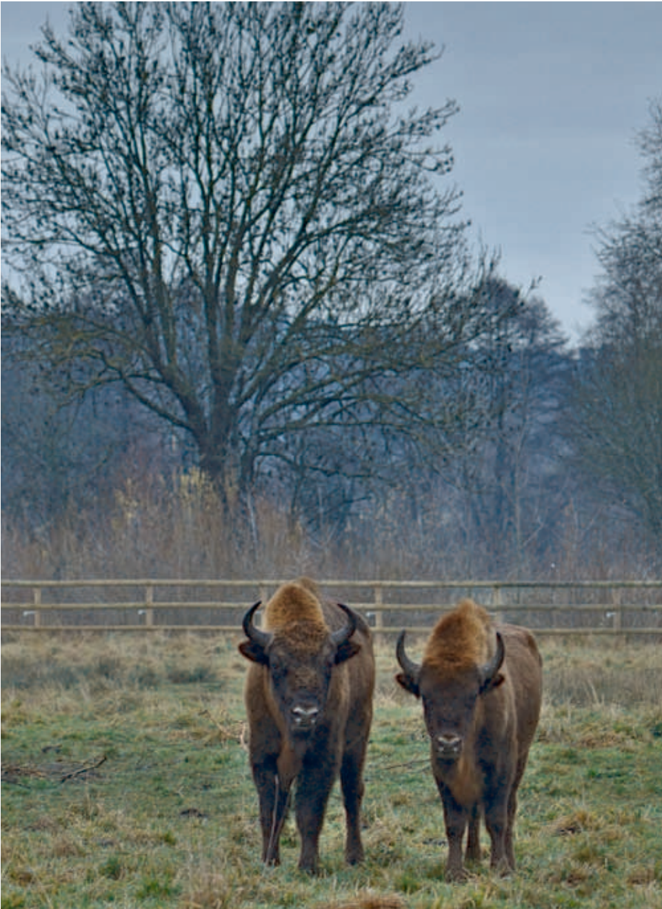
A couple of European bison