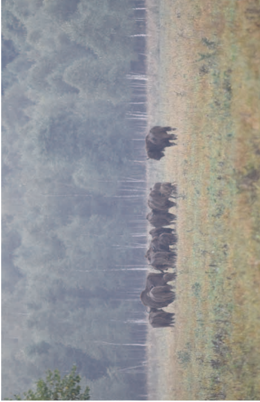
Free-living herd of the European bison