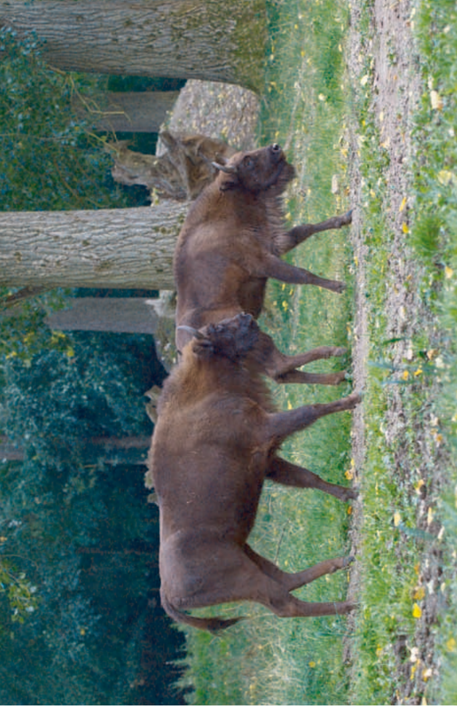
F 14245 DAMINGA and F 14603 DADONNA