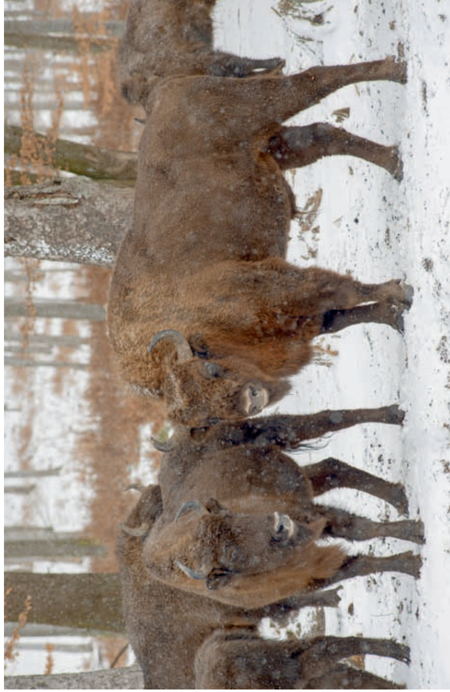
Free-living herd of the European bison