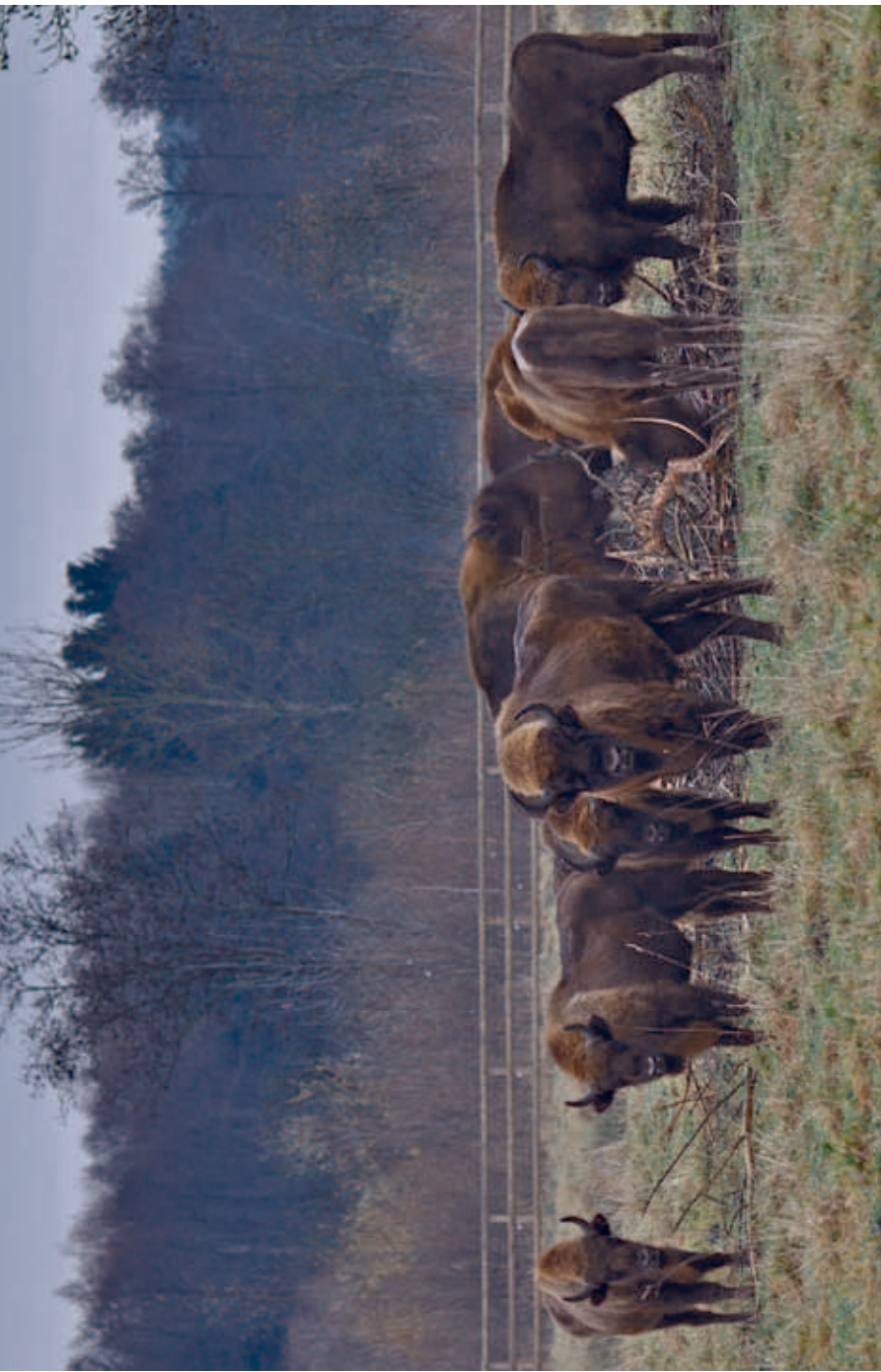
European bison herd