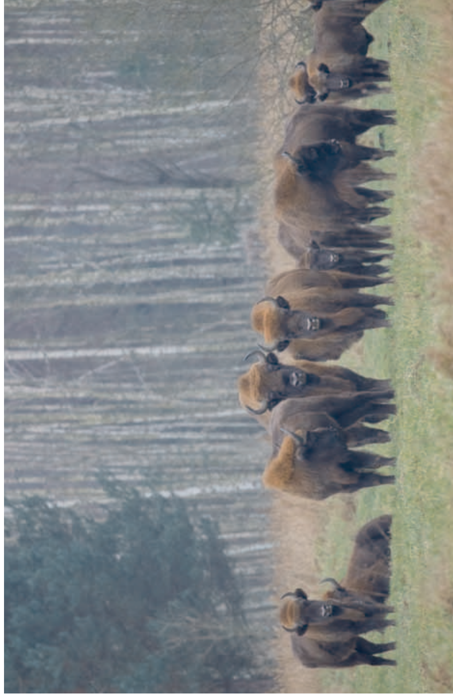
Free-living herd of the European bison