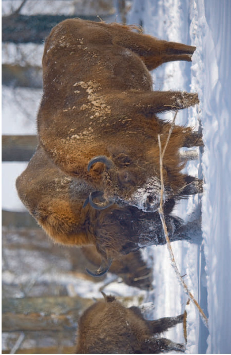
A couple of European bison