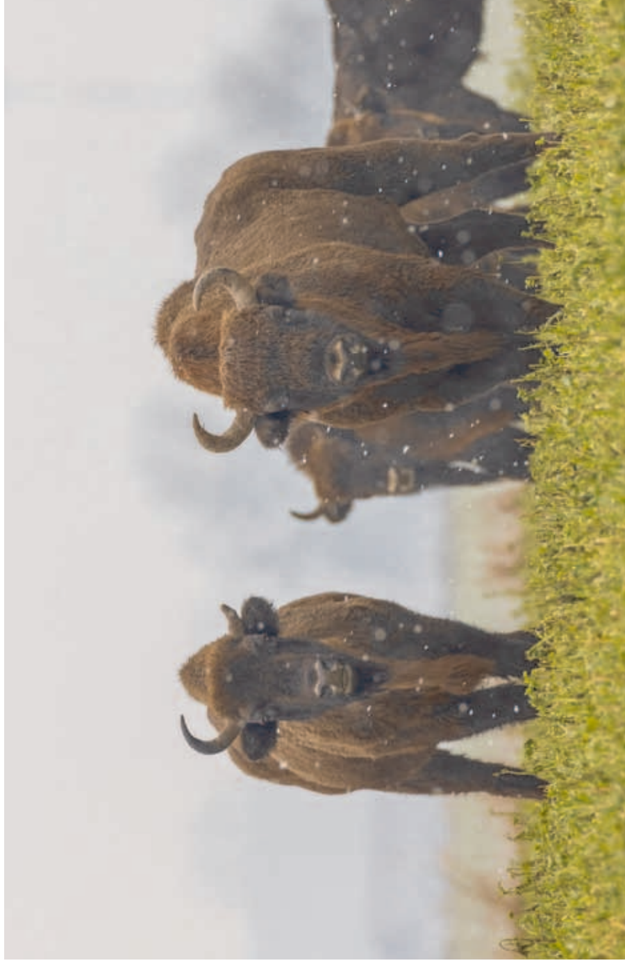
Free-living herd of the European bison on a rape field