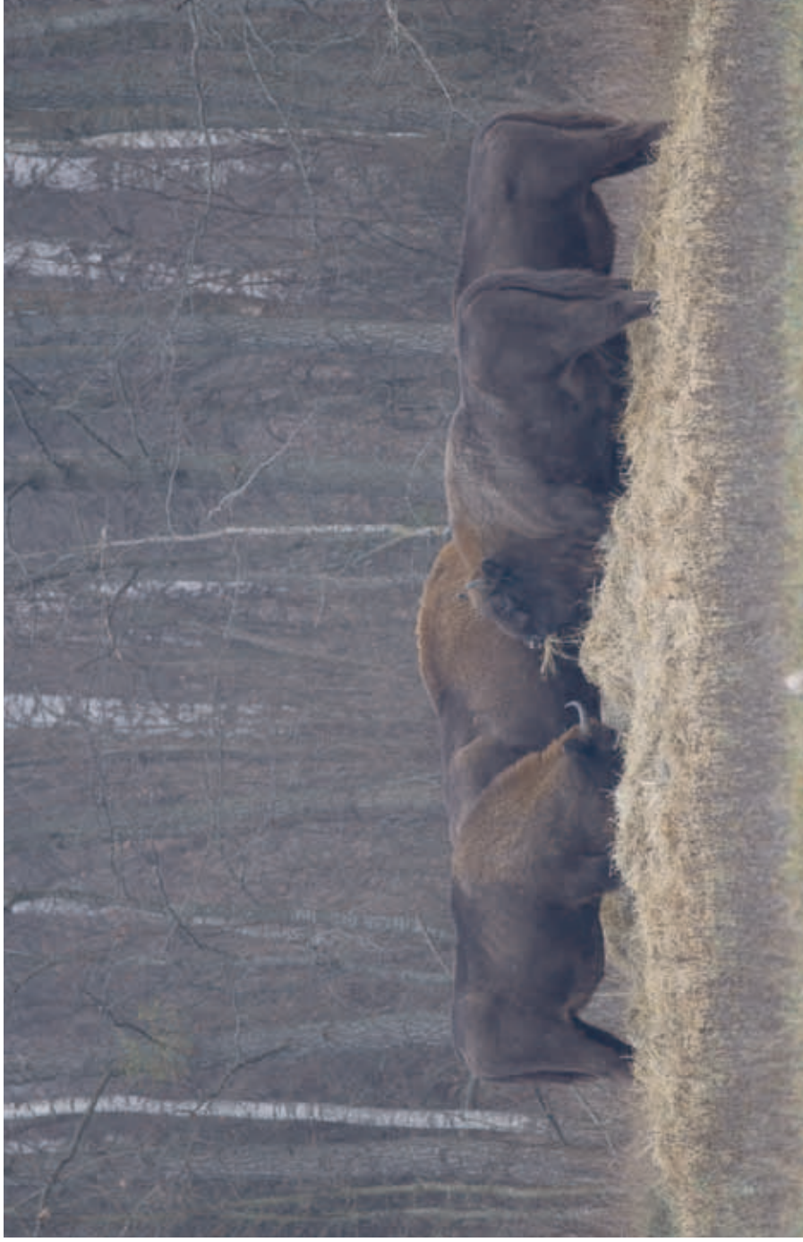
Free-living herd of the European bison