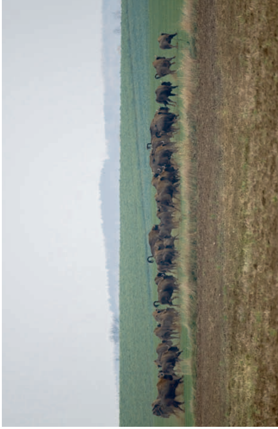
Free-living herd of the European bison