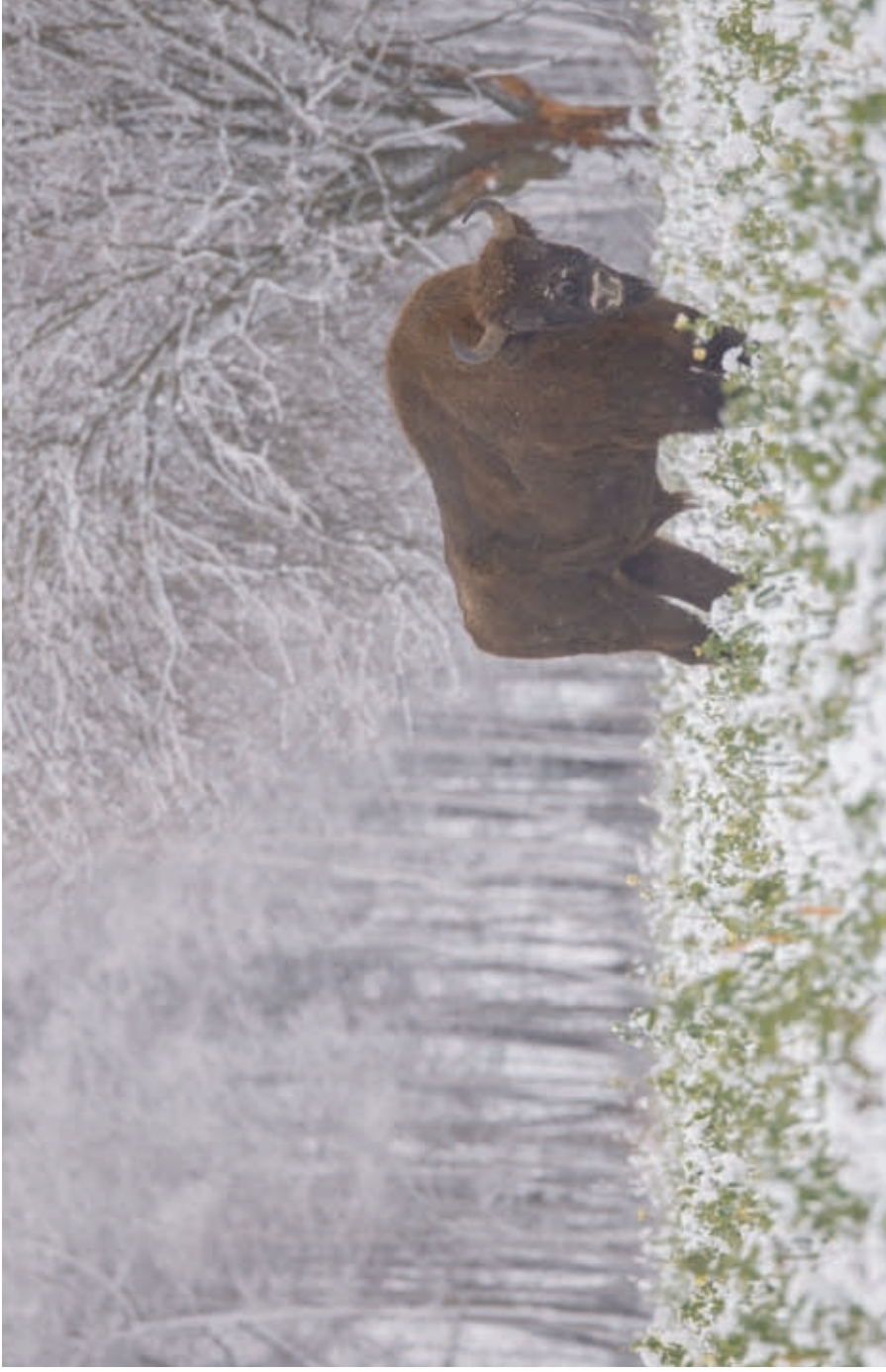
A bull from free-living herd on a rape field