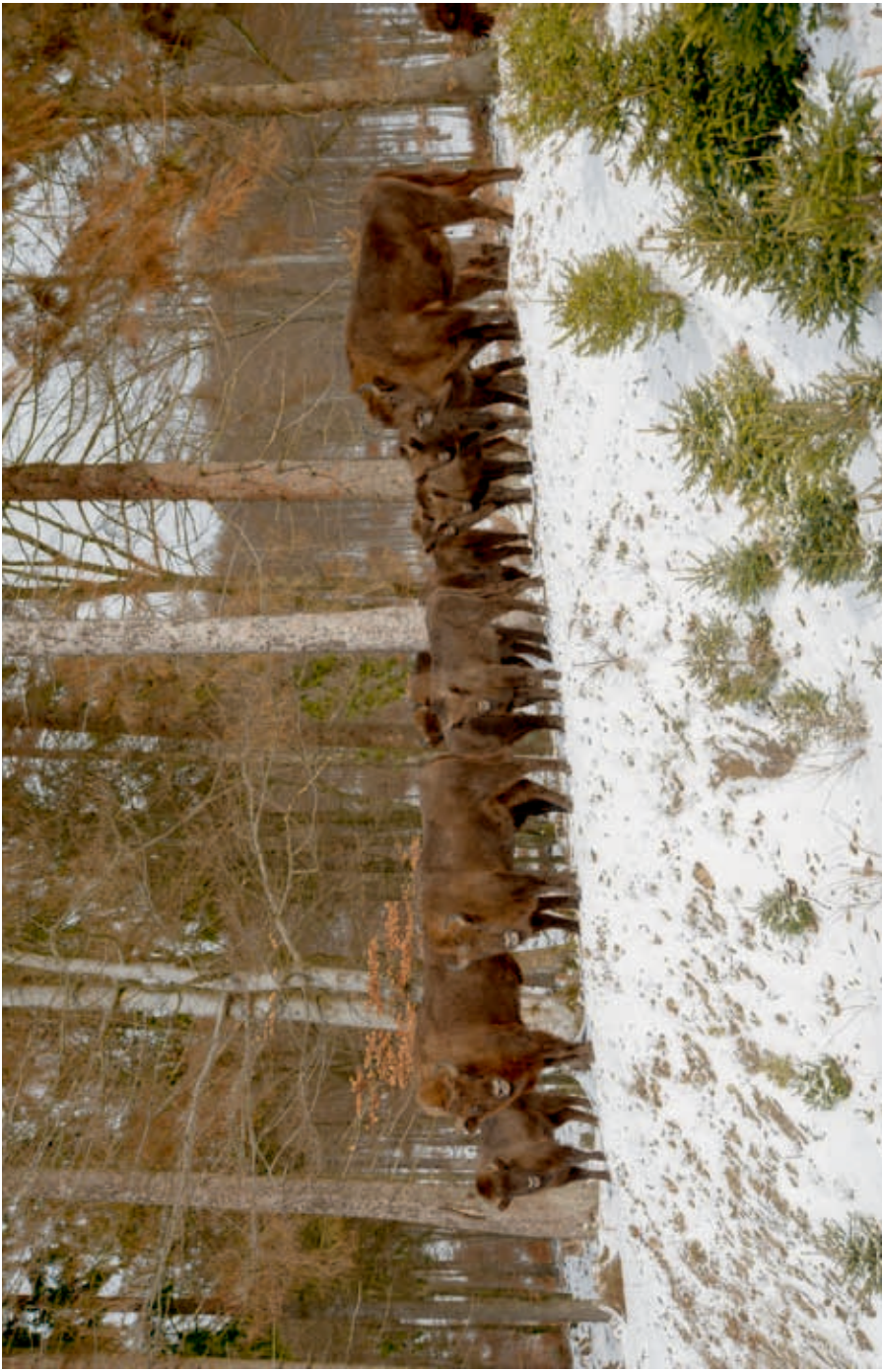
Free-living herd of the European bison