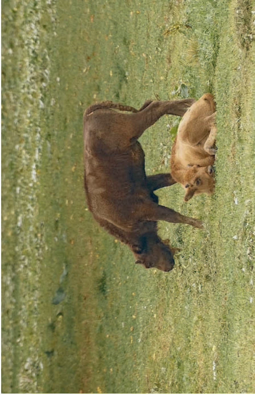
F 14775 POGAWĘDKA (standing) and M 14777 POMŚCIBÓR (lying)