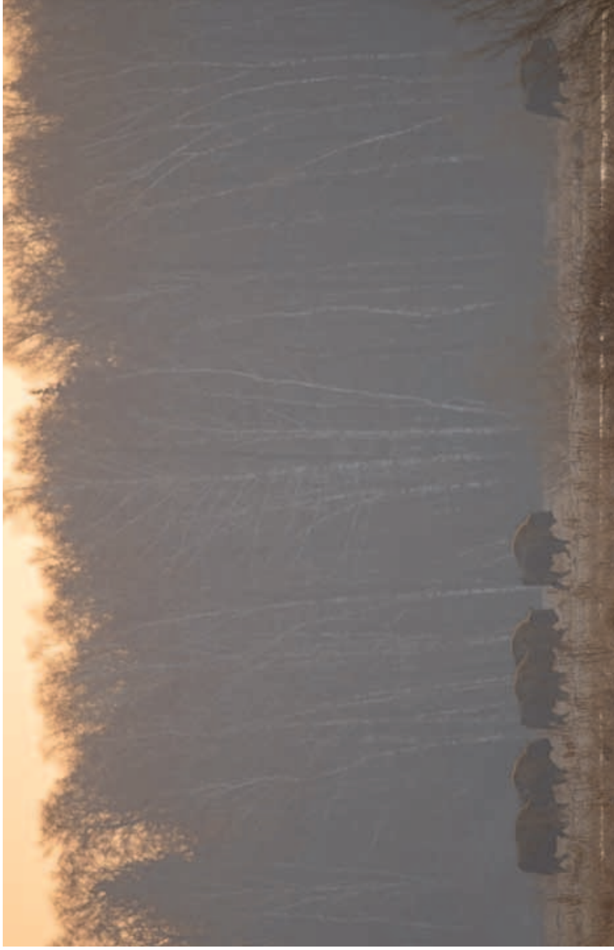
Free-living herd of the European bison