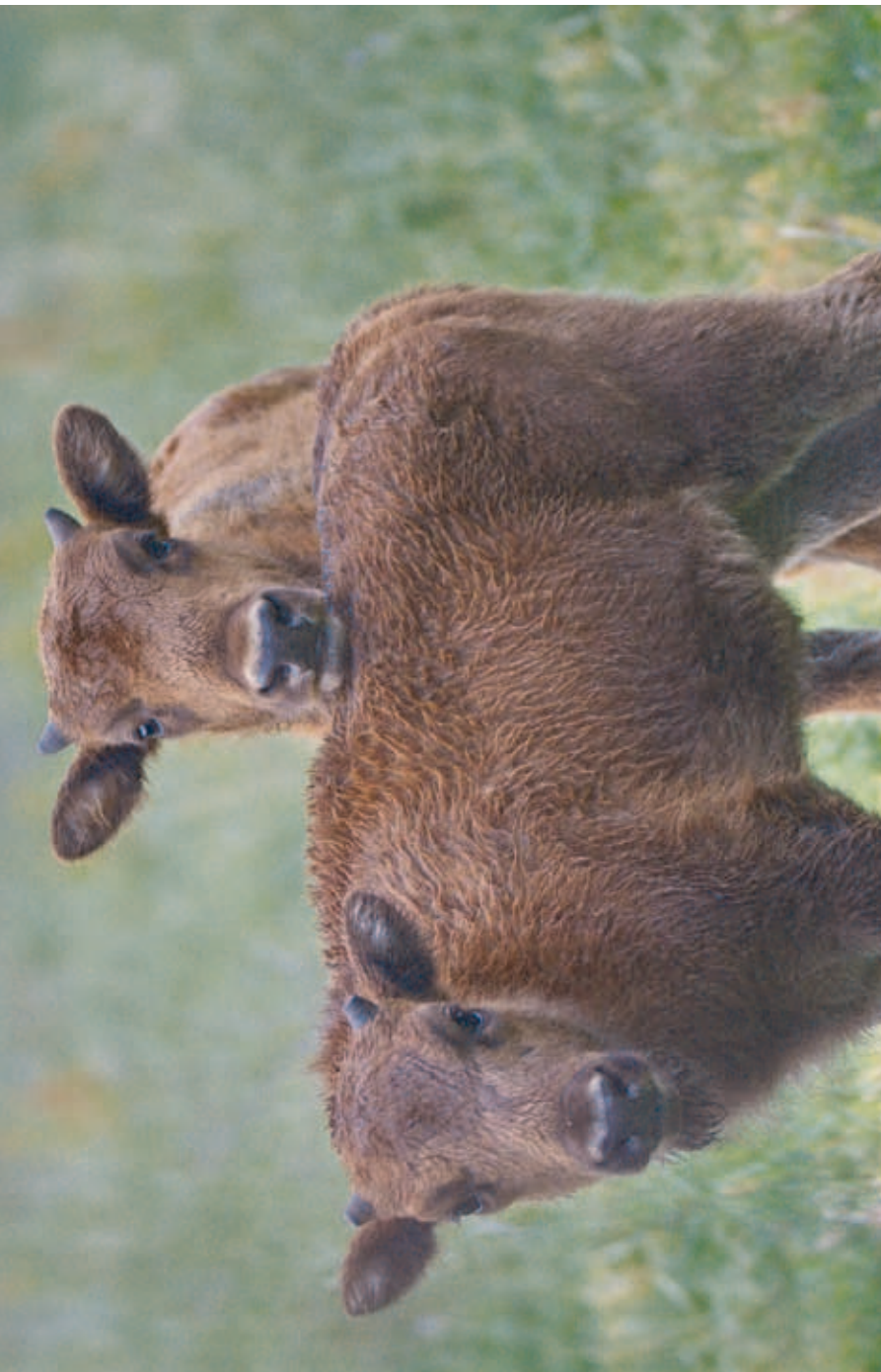
M 14717 SPAHN (in front) and M 14710 SPOVID

Springe, 11.07.2020