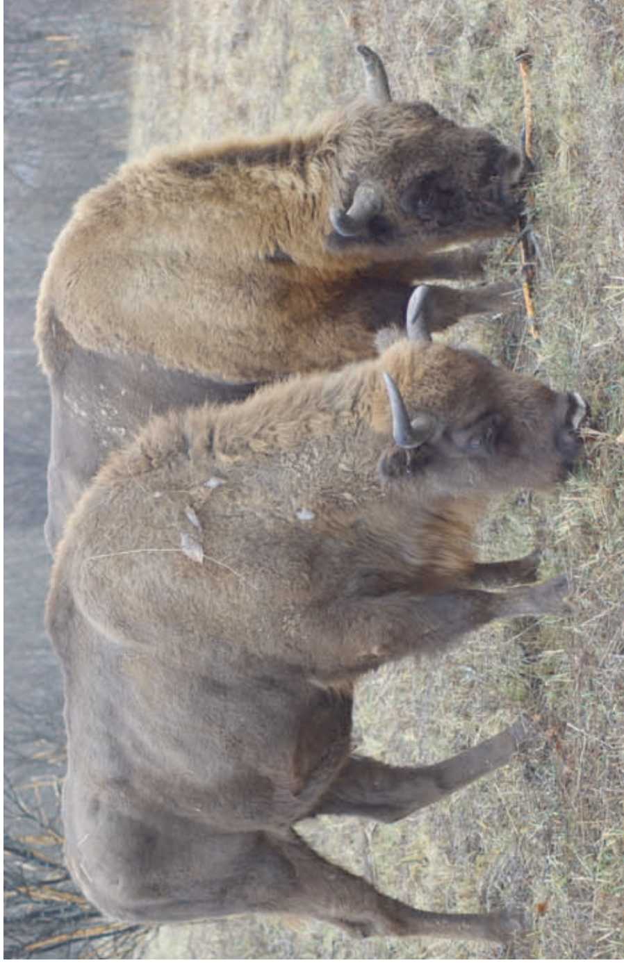
F 12900 MUCHACHA and M 12539 MEGAN