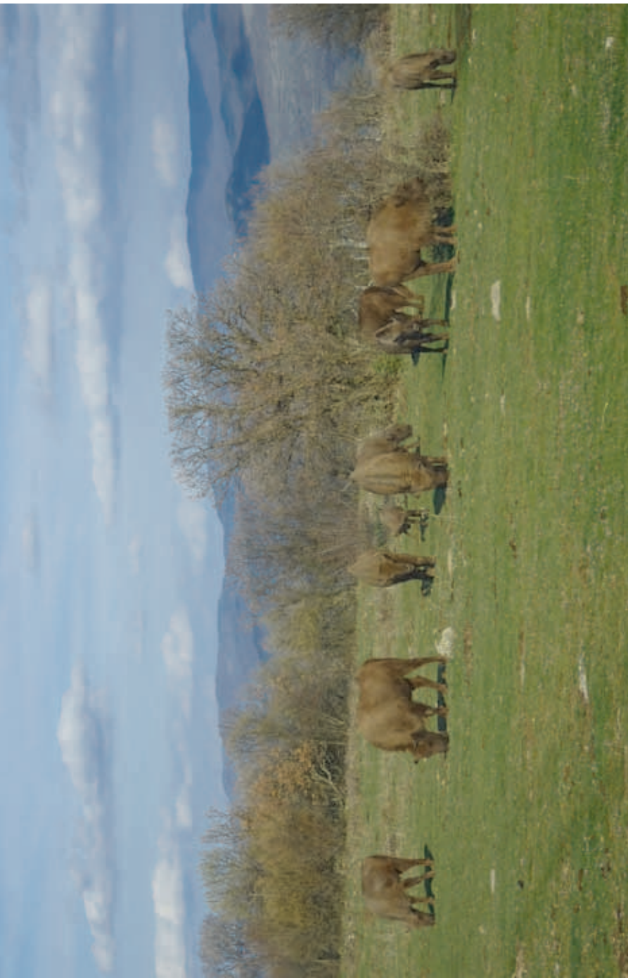
Free-living herd of the European bison