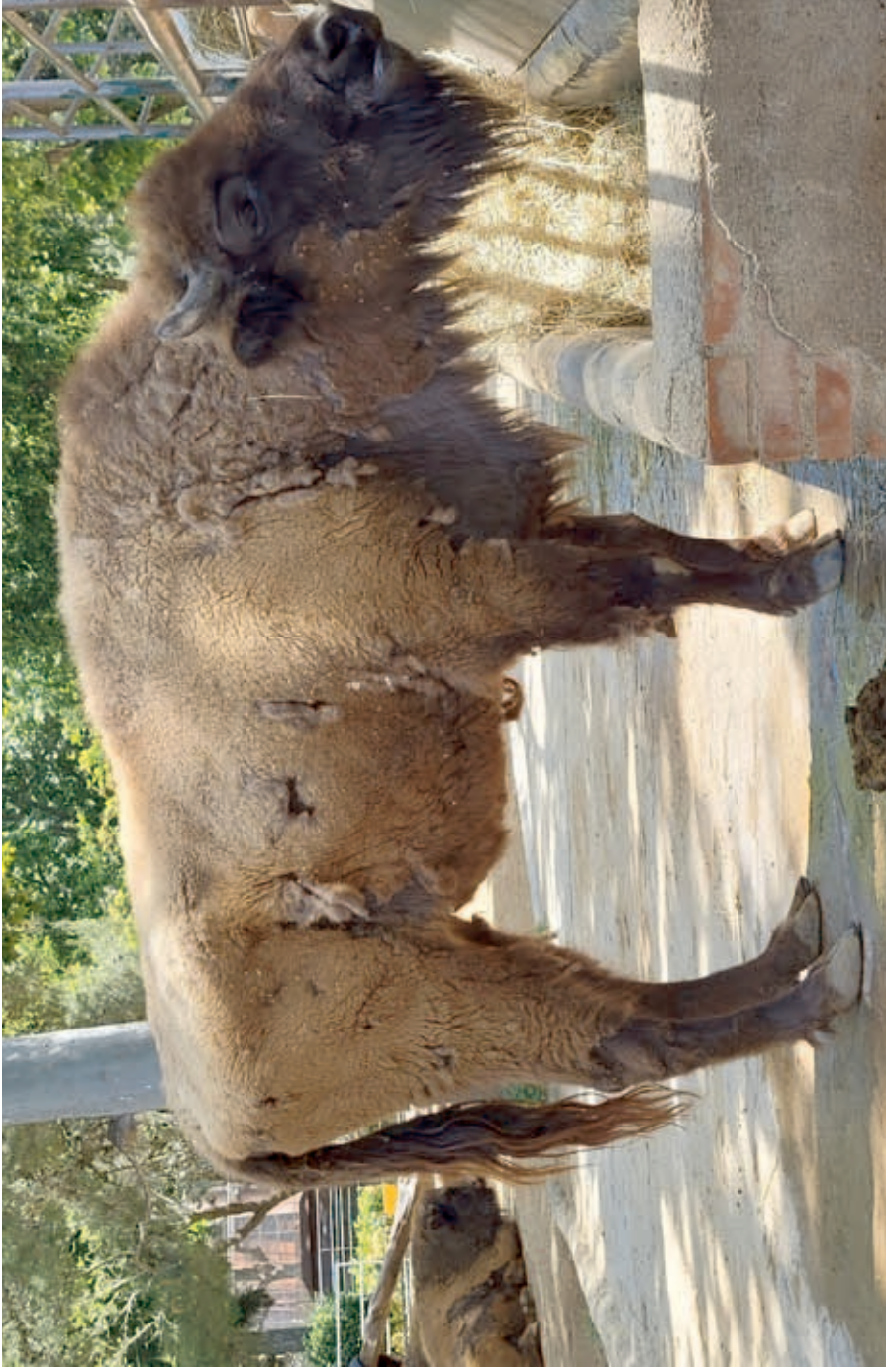
The oldest living European bison: 32-years-old F 6932 ESTACA

Barcelona, 25.05.2021