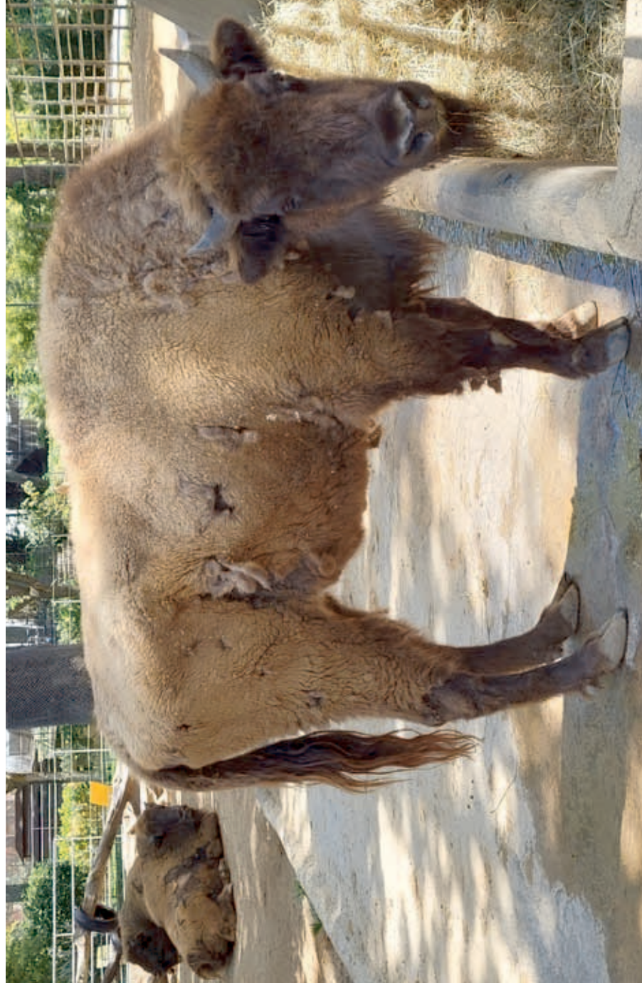
The oldest living European bison: 32-years-old F 6932 ESTACA