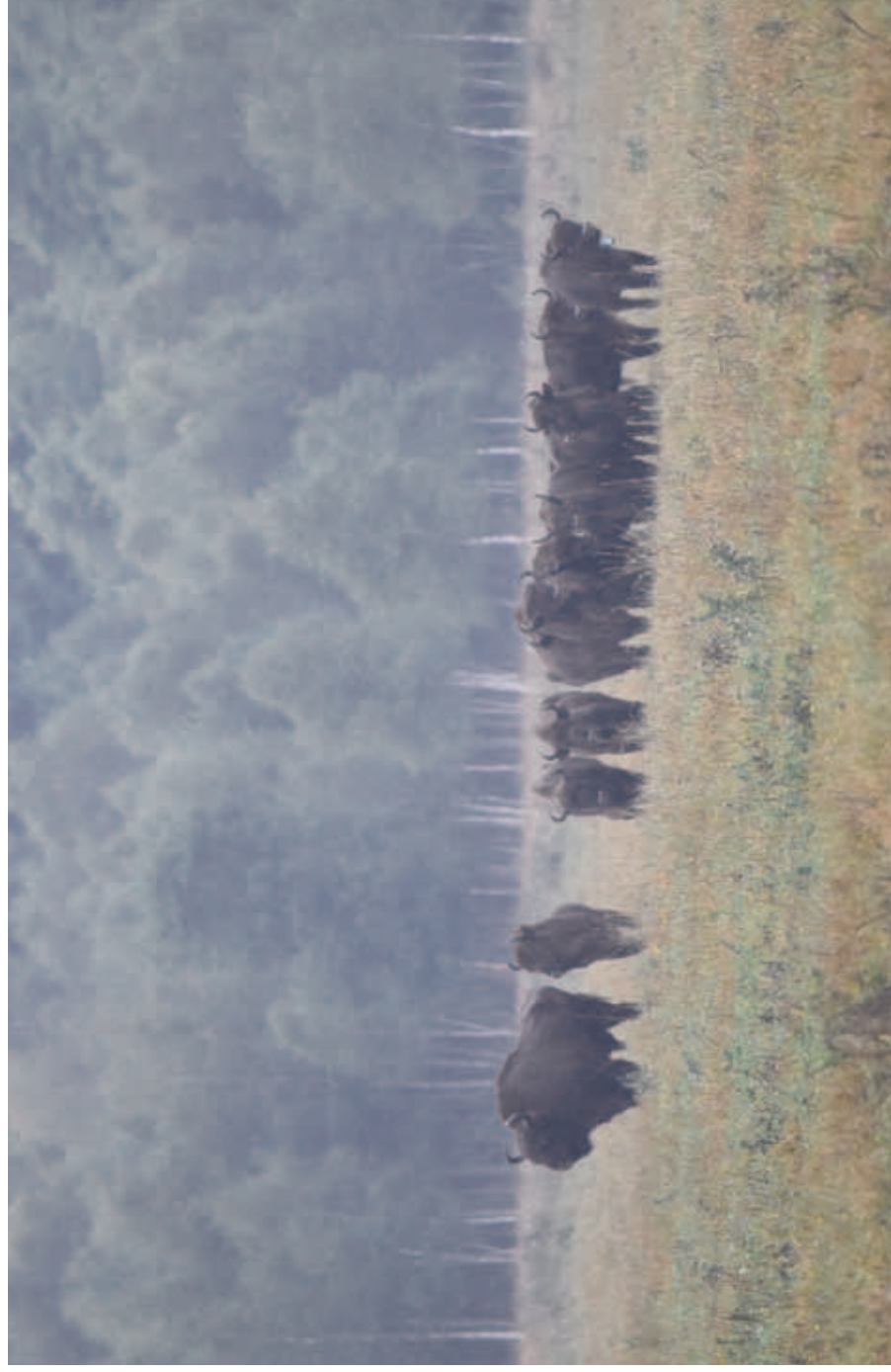
Free-living herd of the European bison