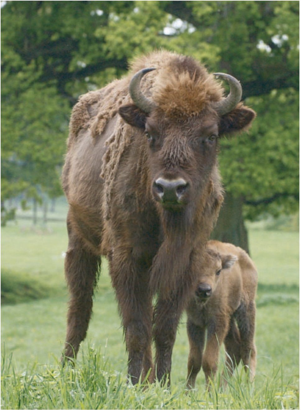
F11032 ZARANA, M 12668 ZAMBAL