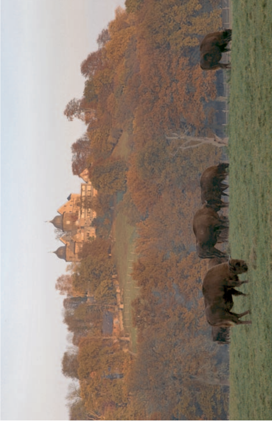
European Bison in front of Sababurg castle